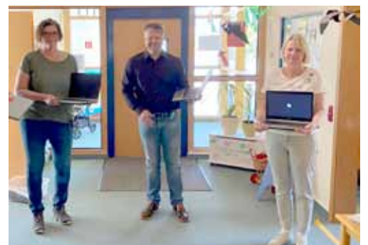
↓ Übergabe an die KiTas Neunkirchen und Speikern (Trägerschaft ASB)