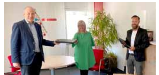
↑ Übergabe an den Schulhort (Trägerschaft AWO)